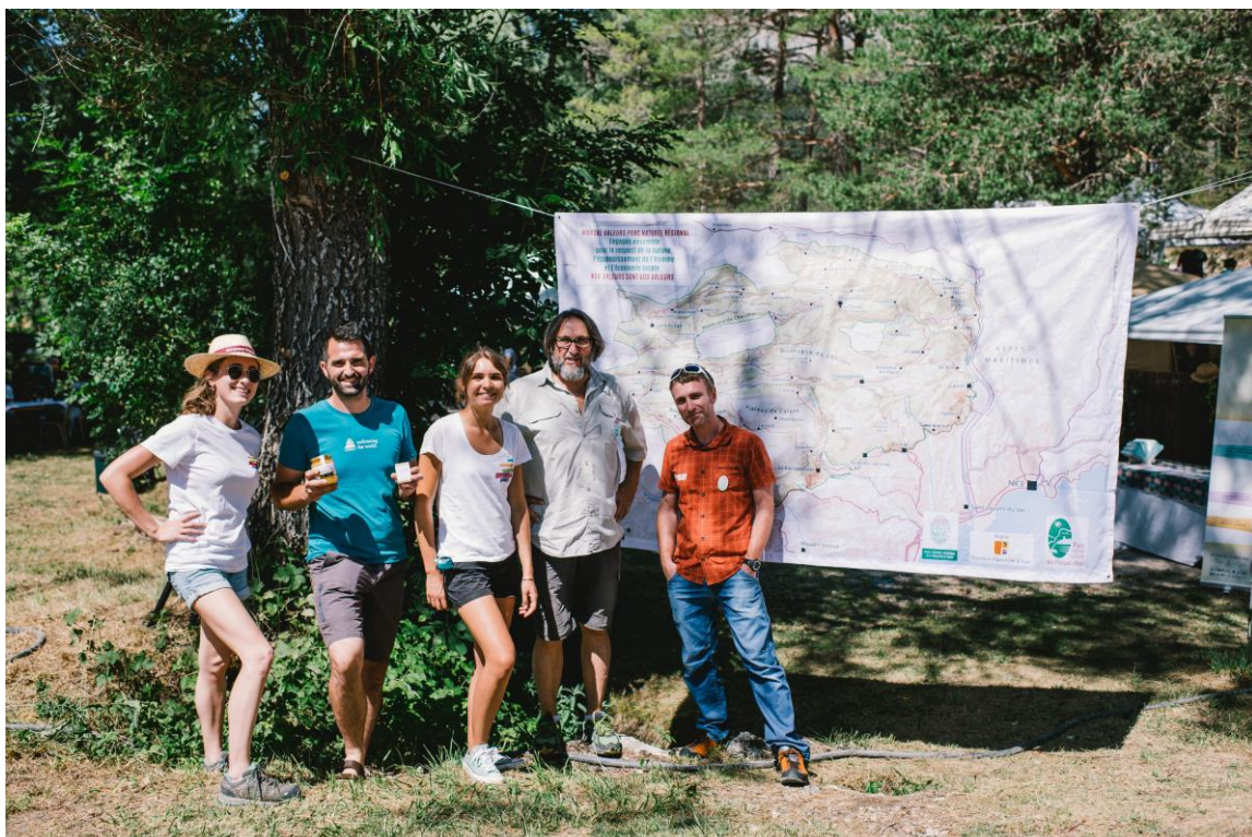
Rucher Abelha, Les Géophiles et Activ Roc à la Fête du Parc le 13 juillet 2019