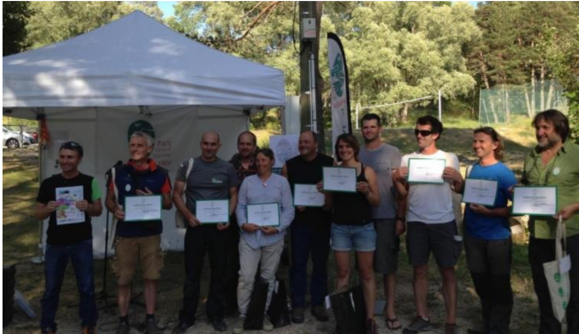
Les premiers marqués des Préalpes d'Azur lors de l'évènement de lancement de la marque le 16 juin 2017

Depuis le lancement officiel de la Marque « Valeurs Parc naturel régional » dans les Préalpes d'Azur le 16 juin 2017, le réseau se déploie avec de nouveaux bénéficiaires qui ont rejoint la Marque en 2018 et 2019 !